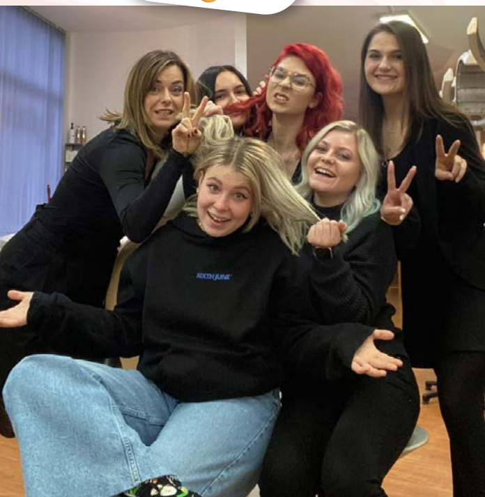
BASIC SEMINAR, Linz, Jänner 2023