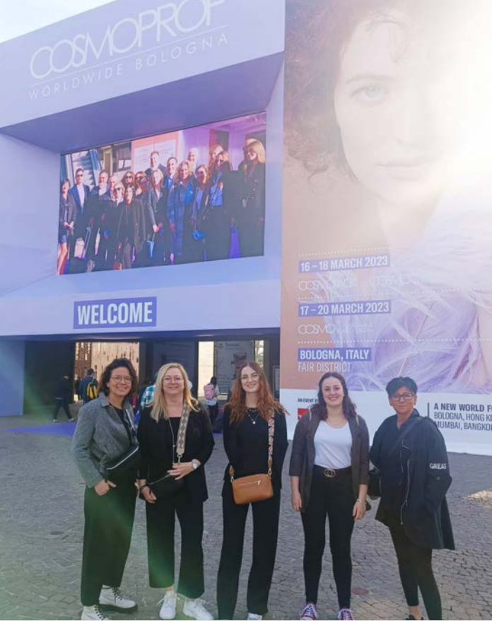
MESSE COSMOPROF, Bologna, März 2023